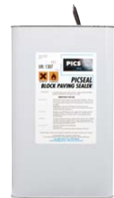
PICSEAL yfirborðsefni 5 og 25 lítra