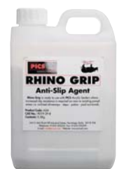
PICS Rhino Grip hálkuvörn