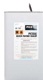
PICSEAL yfirborðsefni 5 og 25 lítra