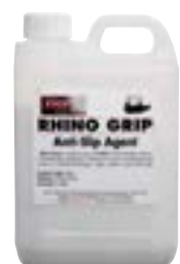
PICS Rhino Grip hálkuvörn