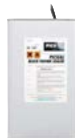
PICSEAL yfirborðsefni 5 og 25 lítra