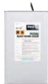
PICSEAL yfirborðsefni 5 og 25 lítra